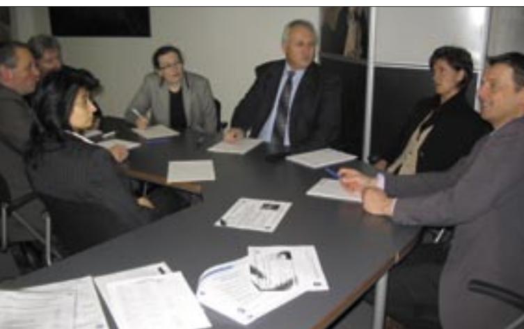
Diskussion rund um die Matrix-Zertifizierung.

Für die Einhaltung des QM-Systems in der Kanzlei ist der Qualitätsmanagementbeauftragte (QMB) verantwortlich. Im Regelfall ist das eine Person aus der Kanzlei. Im Sinne einer neutralen Handhabung sollte diese Aufgabe kein Kanzleihinhaber übernehmen. Um Mitarbeiter/innen auf diese Aufgabe vorzubereiten und dabei zu unterstützen, bietet der StBV zusätzlich QMB-Schulungen an.