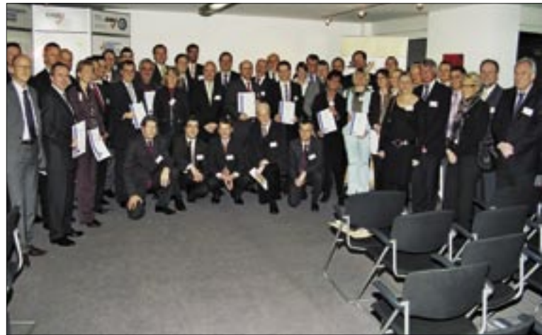
Zufriedene Gesichter bei der Zertifikatsübergabe.

Ebenfalls ein zwingender rechtlicher Bestandteil ist die Durchführung eines „Management-Reviewtages“ durch die Matrixorganisation im Zusammenwirken mit dem StBV.