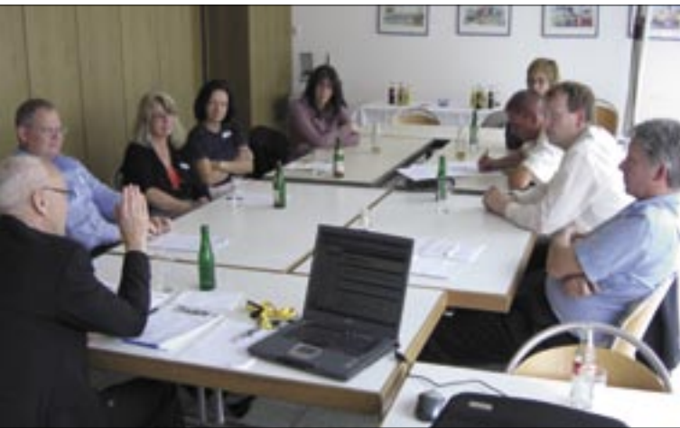
Teamarbeit ist bei den Vorbereitungen zur Zertifizierung gefragt.

Die Matrix-Zertifizierung ist das „Gegenstück“ zur Einzelzertifizierung. Bei der Matrix-Zertifizierung wird nicht nur eine Kanzlei, sondern eine Gruppe von Kanzleien erfasst.