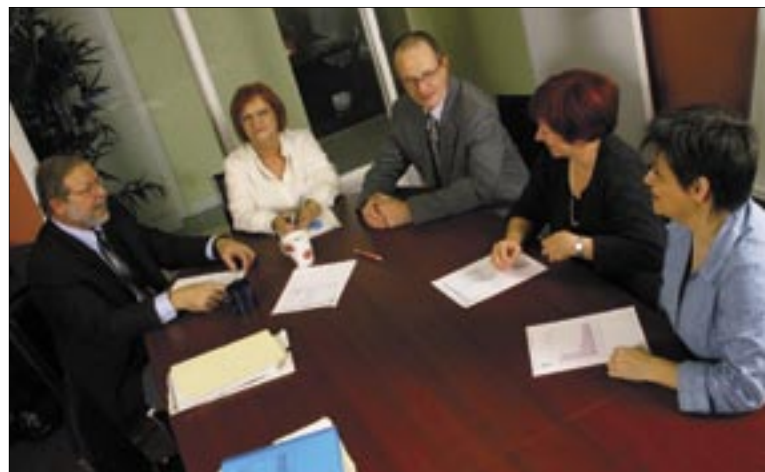
Die Kanzleimitarbeiter sind in die Implementierung der Kernleistungsprozesse involviert.

Zu den Unterstützungsprozessen zählen insbesondere Dokumenten- und Datenmanagement sowie interne Audits und Kooperationen.