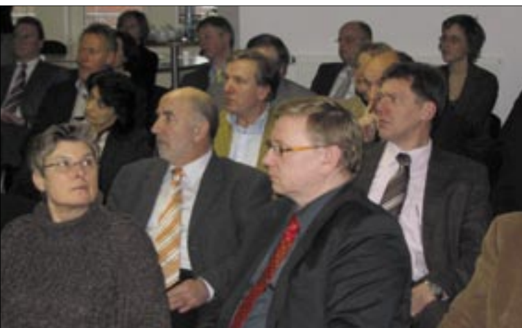
Die Repräsentanten der zertifizierten Kanzleien verfolgen interessiert die Informationen am Management-Reviewtag.

Daneben werden aber auch weitere Entwicklungen im QM-System beschlossen. Diese können darin bestehen, dass weitere Prozesse neu definiert werden (beispielsweise „Steuerfahndung“, „Betriebsprüfung“) oder die Definition neuer Geschäftsfelder wie „Rechtsberatung“ und „Wirtschaftsprüfung“. Dabei ist hervorzuheben, dass die teilnehmenden Kanzleien selbst bestimmen, in welcher Ausrichtung sich die Matrix-Zertifizierung fortentwickeln soll.